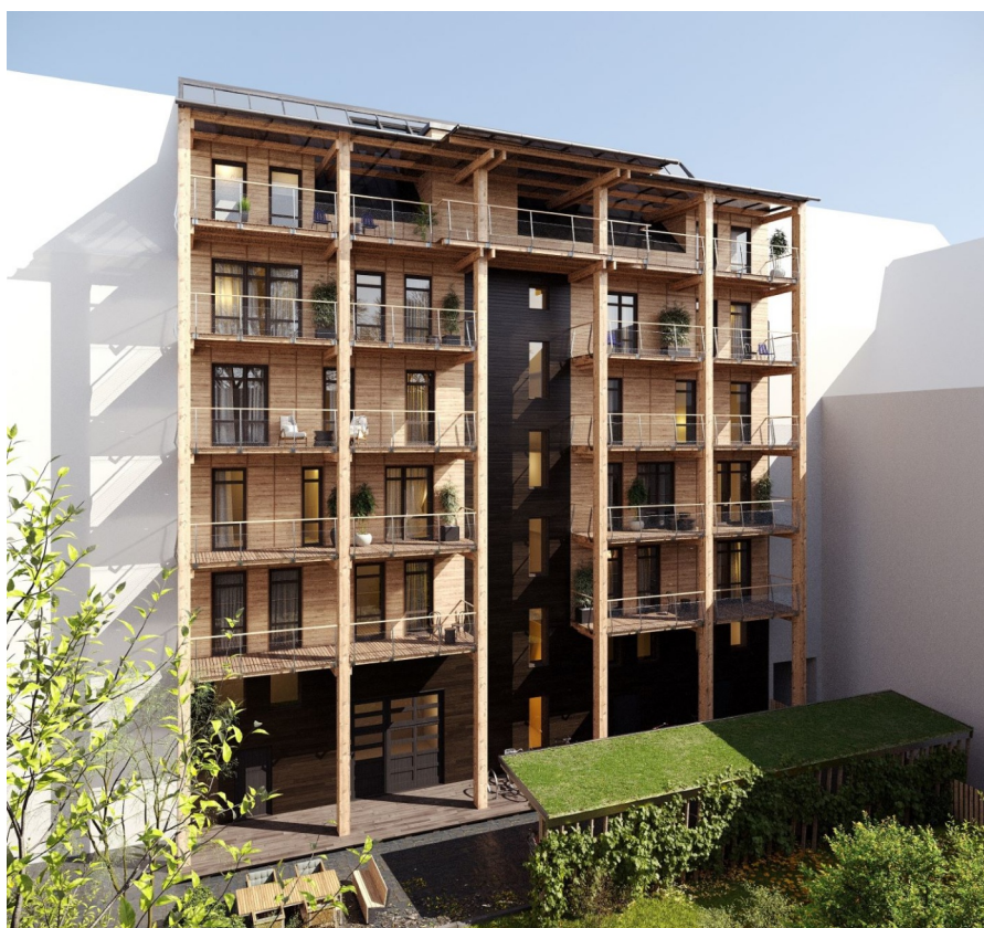
Byggherregemenskapen T4 sedd från gården. Huset kan bli många lägenheter eller en enda stor gemenskap. De som engagerar sig i projektet avgör tillsammans.

byggstart kan man spara den vinst- och riskmarginal på 10-20 procent, ibland mer, som finns i alla kommersiella projekt. I stället är man med i en tredimensionell fastighetsdelning och tar därefter sin andel av de faktiska kostnaderna – och har motsvarande inflytande över hur projektet utvecklas. Eftersom man äger sin del av huset som en egen fastighet finns det nästan inga gränser för vad man kan göra med den, så länge man respekterar sina grannar.