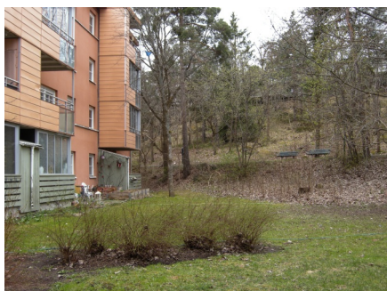
kollektivhuset Elsa Beskow/Orion är det nära till naturen.

En hörnlägenhet på 84 kvadratmeter och stor balkong blev vår.