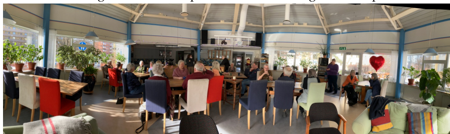
Majbackens trevliga lokaler fungerade bra för idébyttardagen.

IRENE KAPPER KOLLEKTIVHUSET DUNDERBACKEN