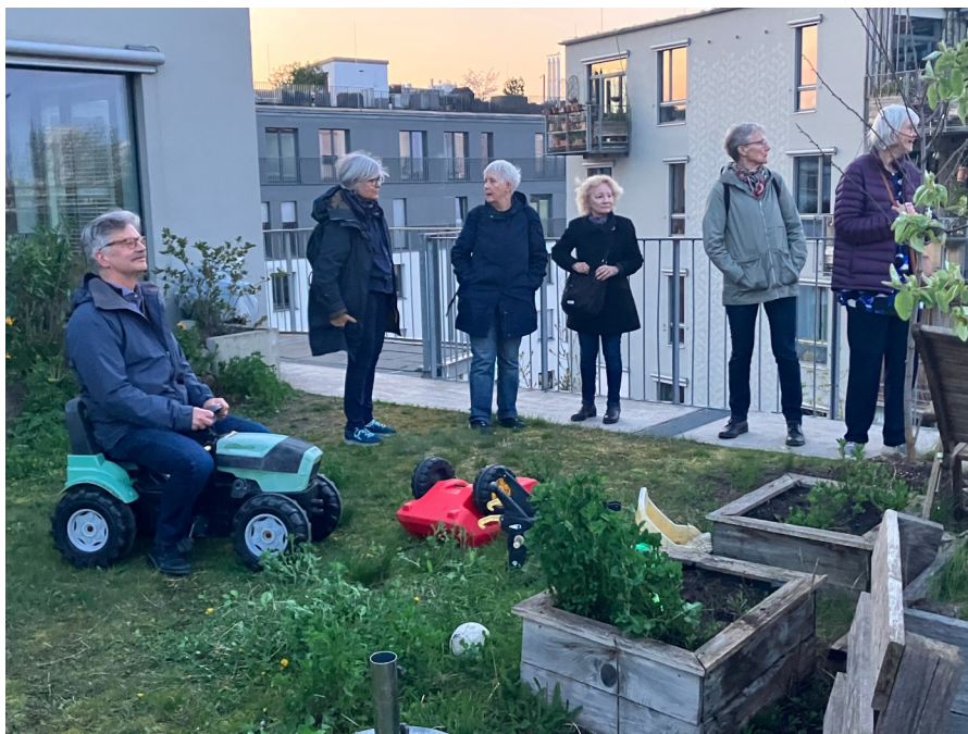
Svenskgruppen på terrassen till huset där kollektivet Spree WG har tolv lägenheter i två av husets åtta våningar. Terrassen är gemensam för alla som bor i huset.

Grundtanken här är att middag serveras alla dagar. Det finns en uttalad förväntan om att alla ska turas om att laga. Samtidigt grundas organisationen på frivillighet. Den som vill laga middag antecknar det på en griffeltavla i köket. Den som vill äta skriver dit sina initialer, så