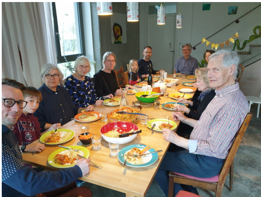
Gemensam middag med de boende i Spree-WG och den svenska besöksgruppen.

De blivande hyresgästerna finansierade delvis bygget genom att köpa andelar i projektet. De var aktiva i planeringen. När husen var klara bildade man en kooperativ boendeförening, där kollektivet ingår som en undergrupp. För att bli medlemmar i kooperativet betalar hyresgästerna en summa, andelen betalas tillbaka om man flyttar. Den kooperativa föreningen hyr ut lägenheterna och sätter hyrorna. Tanken är att man ska betala vad det kostar, inte mer. Hyran ligger idag en bit under genomsnittet för Berlin. I husen finns också lägenheter som har köpts ut och därmed kan säljas på bostadsmarknaden. Det har lett till en del konflikter inom den kooperativa föreningen.