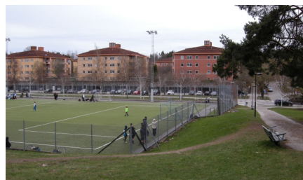
Kollektivhuset Elsa Beskow i Fruängen består av sex punkthus. Tidigare kallade man sig Orion.

mig och en yngre granne som ledde mig in i mörkrummets mysterier. Med tiden blev vi goda vänner med hans familj och jag fick äran att bli sonens gudmor. De tog även över lägenheten när det var dags för mig att flytta från Fruängen.