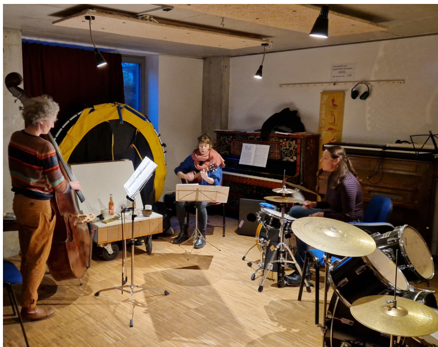
En trio bjöd in oss för att lyssna på medryckande musik i musikrummet som ligger i husets gemensamma bottenvåning.